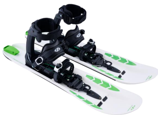
Crossblades con attacchi Softboot

Le Crossblades sono disponibili sia con attacchi per scarponi morbidi come scarponi da montagna, scarponi da trekking, scarpe da trekking, sia con attacchi per scarponi rigidi come scarponi da sci e alpinismo.