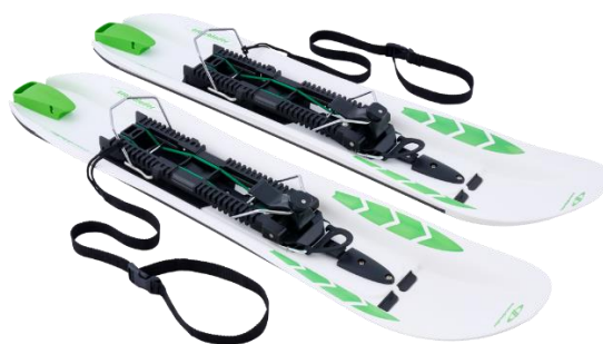
Crossblades con attacchi Hardboot